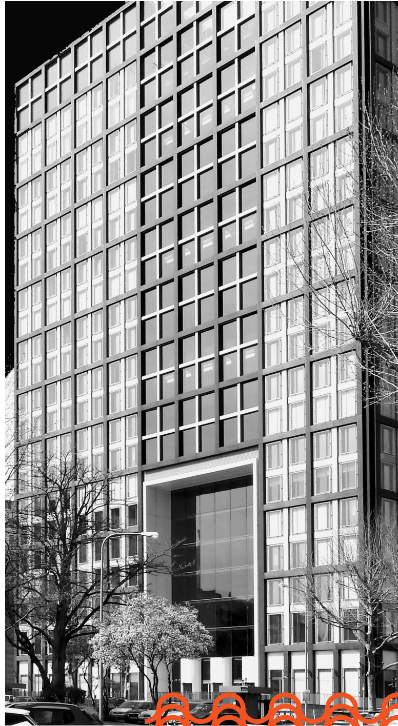
Kuva: günter, Pixabay.

Kone- ja laiteinvestoinnit kasvoivat kohtalaisesti vuosina 2021–2023. Vuonna 2023 erä kasvoi 2,6 prosenttia. Ennustejaksolla kone- ja laiteinvestoinnit jatkavat samankaltaisella kasvu-uralla. Vuonna 2024 kasvu on hie-man tulevia vuosia hitaampaa, yleisen taloustilanteen ja teollisuuden vaimean vireen vuoksi. Korkotaso on kään-