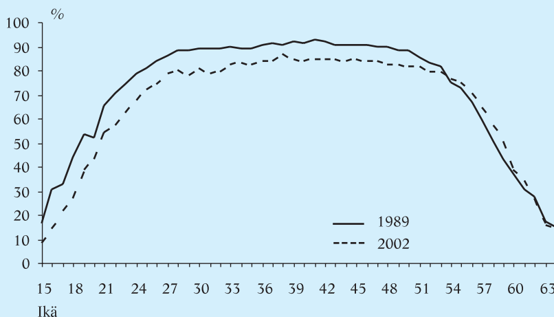
Kuvio 1. Työllisyysasteet iän mukaan vuosina 1989 ja 2002.

Työikäinen väestö keskittyy jatkossa ikäryhmiin, joissa työllisyysasteet ovat alhaiset.