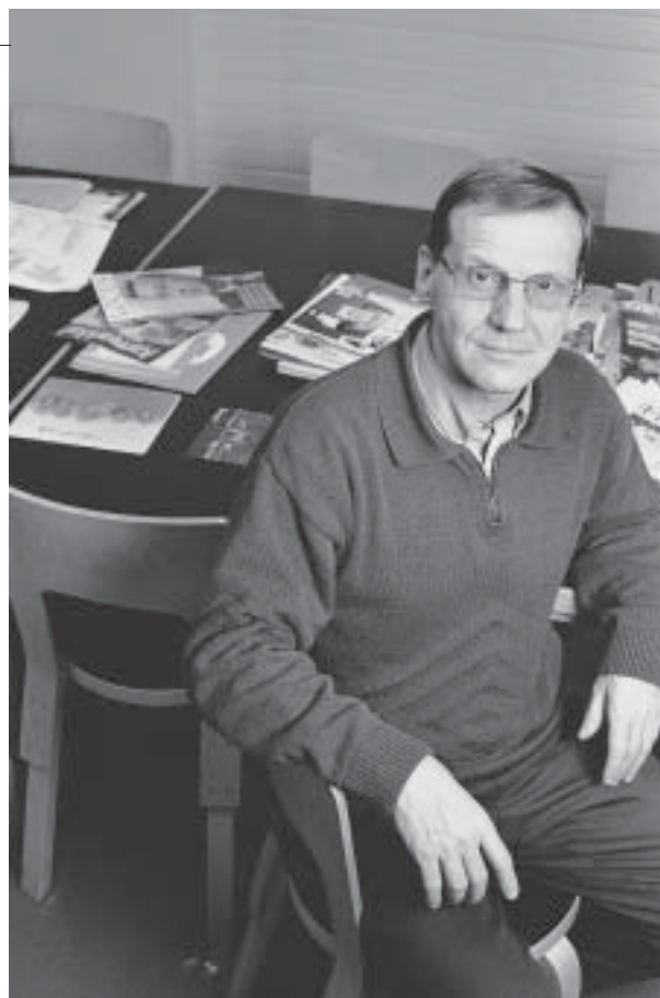
Pekka Tiaista on viime aikoina eniten työllistänyt työministeriön tammikuussa 2003 julkaisema Työvoima 2020-loppuraportti, johon oheinen kirjoitus pitkälti perustuu.

Työttömyyden alentamiskeinoja voitaisiin lähestyä tarkastelemalla sen rakennetta ja arvioimalla erilaisten työttömien työllistymismahdollisuuksia. Tämä on tarpeellista muttei kuitenkaan riittävää, ja onkin pohdittava, miten työttömyyden purku on hoidettavissa osana työllisyyspolitiikan kokonaisuutta. Avaintekijöitä ovat tällöin talouskasvu, työn tuottavuus, työaika ja työvoiman tarjonta. Kun halutaan etsiä ratkaisuja työttömyyteen, on riittämätöntä tarkastella vain yhtä niistä. On otettava huomioon kukin tekijä ja niiden vuorovaikutus.