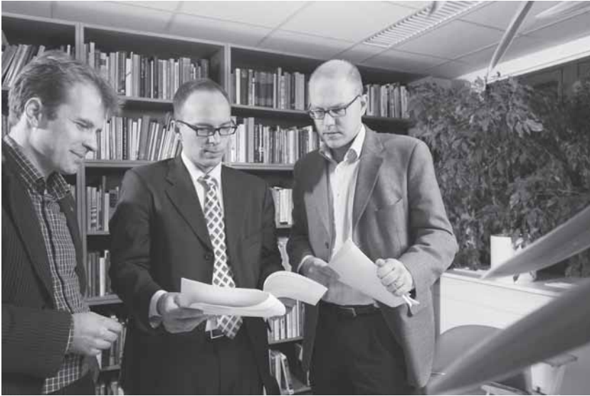
Kyselytutkimuksen tulos yllätti tutkijatkin. Vastaajat kannattivat verotuksen progressi- on kiristämistä ja tasaisempaa tulojakaamaa jopa keskimääräisen tulotason kustan- nuksella.

kuin yllä. Hintalapun suuruus ei vaikuttanut millään lailla näiden vastausten jakaumaan.